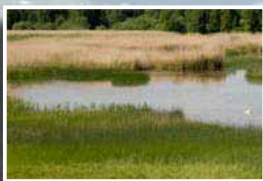
Våtmark med vattenspegel