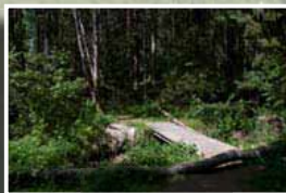
Upprustade stigar - även för cyklister