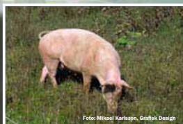
Markberedning med grisar