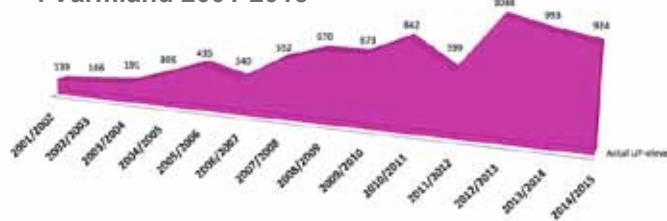
Utvecklingen av antal UF-företagare i Värmland 2001-2015