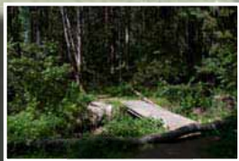
Upprustade stigar - även för cyklister