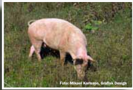
Markberedning med grisar