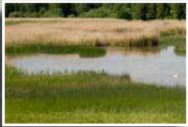
Våtmark med vattenspegel