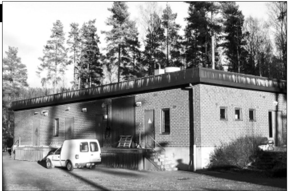
VA-verket vid Fryksta