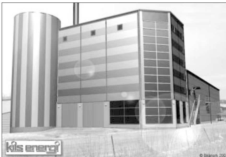
Visualisering av Tippen-pannan.

Till pannan byggs också en beredningsanläggning. Denna tar bort orenheter och föroreningar ur bränslet som spik och grus m m samt ger bränslet rätt form och storlek för att kunna matas in i pannan.