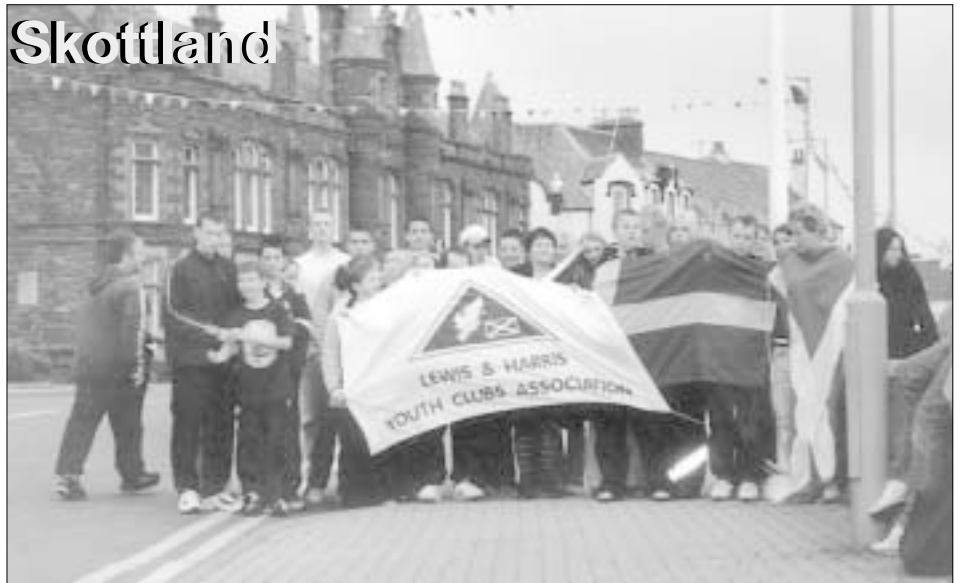
Sista kvällen och dags att plocka ner flaggorna som under hela vår vistelse vajat för vinden i Stornoways hamn.

Maten vi fick var inte så olik vår. Det man blev trött på var att det mesta ser-