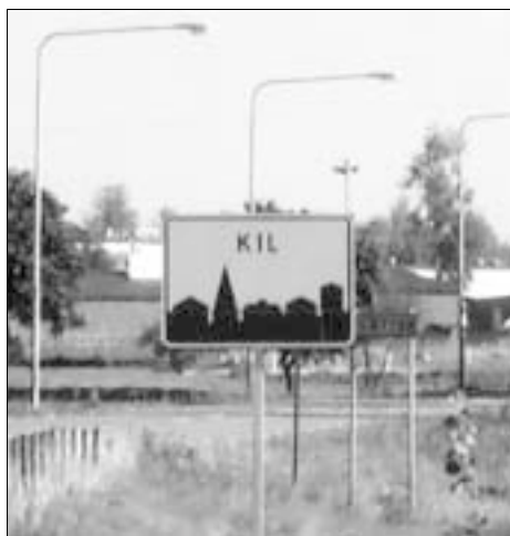
Skylt vid södra infarten till Kil.

De flesta har säkert noterat denna skylt som sitter på olika ställen i kommunen. Märket anger att tätbebyggt område börjar. Det viktiga att komma ihåg när man passerar märket är vilken hastighetsbegränsning som råder. När man passerat märket råder begränsningen 50 km/h om inget annat anges. Det sitter alltså inget förbudsmärke som anger att maxhastigheten 50 km/h gäller, utan märket i sig innebär max 50.