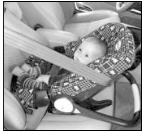
Det allra säkraste sättet att färdas i bil är bakåtvänd.

Barn behöver mer skydd i bilen än vi vuxna behöver. Dels är deras huvud stort och tungt i förhållande till kroppen och dels är deras skelett inte färdigutvecklat. Enligt svensk lag ska barn under sju år ha särskild skyddsanordning – babyskydd, bilbarnstol, bältesstol/kudde. Det allra säkraste sättet att färdas i bil är bakåtvänd. Därför bör de sitta i den bakåtvända stolen så länge som möjligt, upp till ca fyra års ålder. Upp till nio månaders ålder finns det