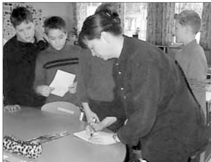
Laura Trenter skriver autografer.

Skolområde 2 hade storfrämmande fredag 31 januari. Årkurs 6 på Dalliden, Stenåsen och Viksta fick besök av Laura Trenter, barnens deckardrottning! Eleverna lyssnade andäktigt till hennes beskrivning av sitt yrke. Sedan var det dags för frågor och de ville aldrig släppa henne. Det är inte var dag man har en livs levande författare hos sig - som dessutom