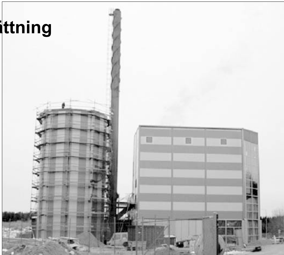
Snart är den nya pannan klar för driftsättning.

Pannan är intressant ur många aspekter. Dels kan olje- och elanvändning ersättas i tätorten till förmån för bio-bränsle. Pannan är troligtvis också den första som möter de högt ställda kraven på avfallsförbränning enligt EU:s nya regelverk. Det finns heller inte någon panna i Sverige av det här slaget som är så pass relativt liten, anpassad till ett mindre samhälles behov. Tidigare har vi i Kil varit hänvisade till Norrköping för att bli av med det brännbara avfallet.